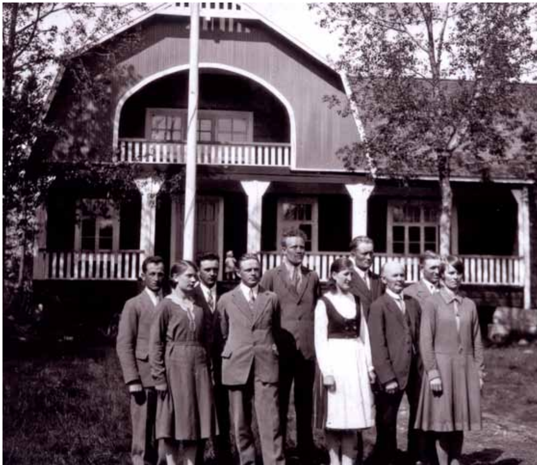
Nuorisoseuralaisia 10-vuotiaan seurantalons edustalla v. 1931.

Sysmän Särkilahden Nuorisoseura vietti marraskuussa 100-vuotisjuhlaansa omalla talollaan. Sadan vuoden aikana seura on ehtinyt kokea monenlaiset muutokset ja toiminnan aaltoliikkeet.